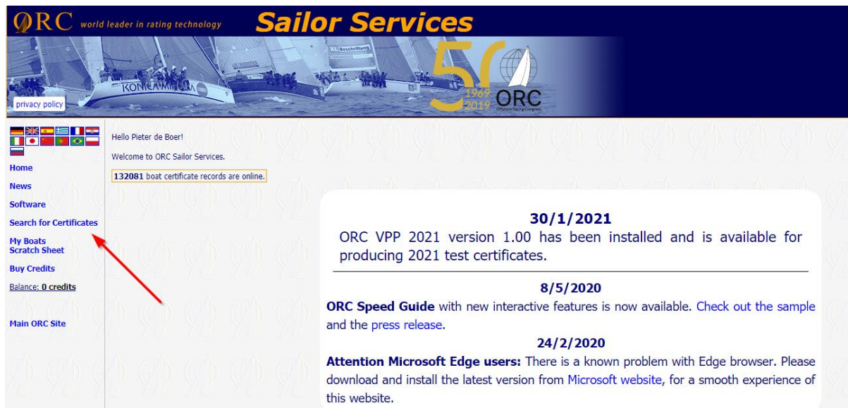
Figuur 3: ORC Portal