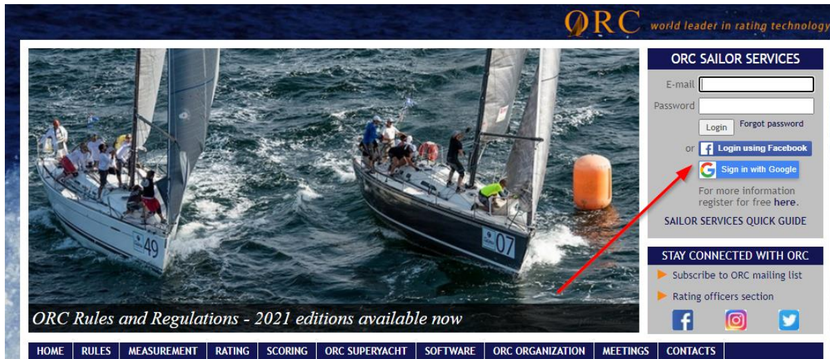
Figuur 2: Inloggen ORC.org

Het is mogelijk om met te kijken welke invloed de zeilen hebben op de rating (voor degenen die dat leuk vinden, en daar een paar euro voor over hebben). Dit kun je doen door naar de website www.orc.org te gaan. Daar aangekomen kun je inloggen door een account aan te maken of je google/facebook account te gebruiken (zie Figuur 2).